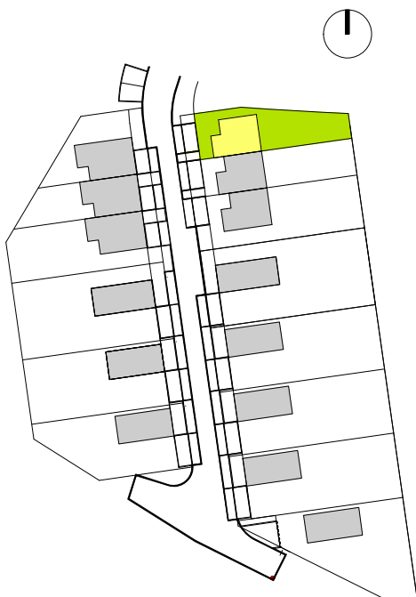
SCHÉMA UMÍSTĚNÍ V LOKALITĚ