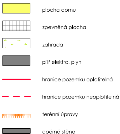
SCHÉMA UMÍSTĚNÍ V LOKALITĚ