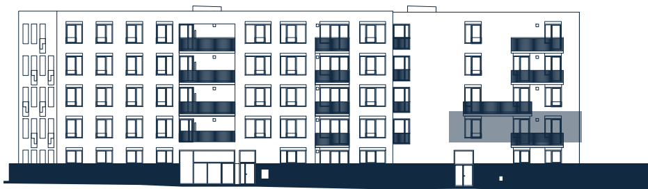
Umístění na podlaží