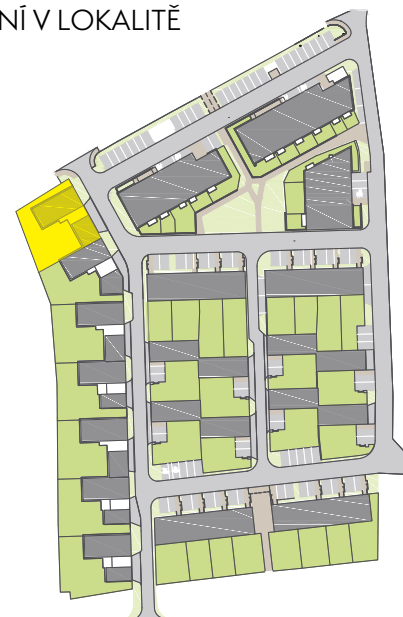
SCHÉMA UMÍSTĚNÍ V LOKALITĚ