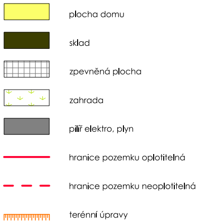
SCHÉMA UMÍSTĚNÍ V LOKALITĚ