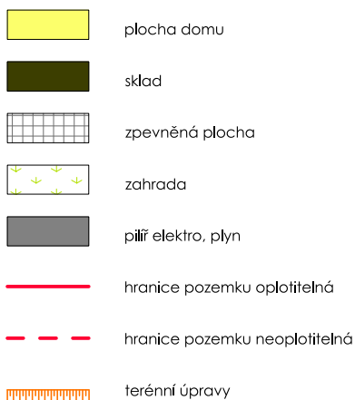
SCHÉMA UMÍSTĚNÍ V LOKALITĚ