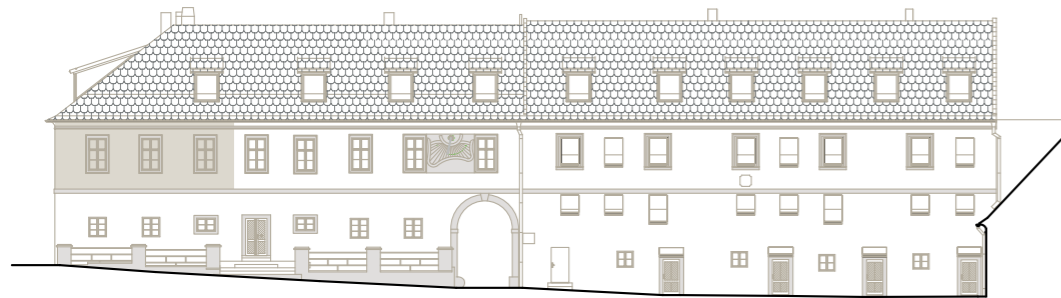
budova C/D (severní křídlo) – pohled z vnitrobloku