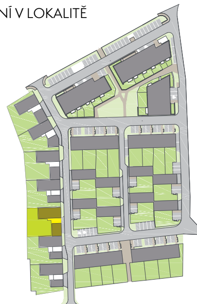
SCHÉMA UMÍSTĚNÍ V LOKALITĚ