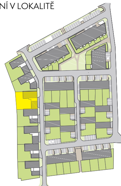
SCHÉMA UMÍSTĚNÍ V LOKALITĚ