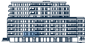
Umístění na podlaží