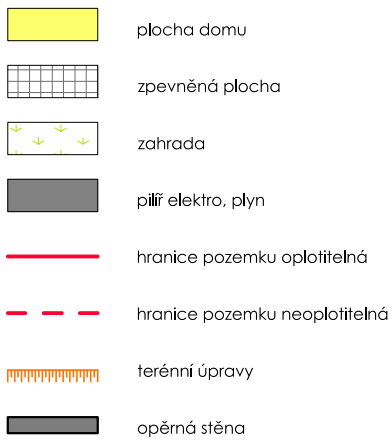
SCHÉMA UMÍSTĚNÍ V LOKALITĚ