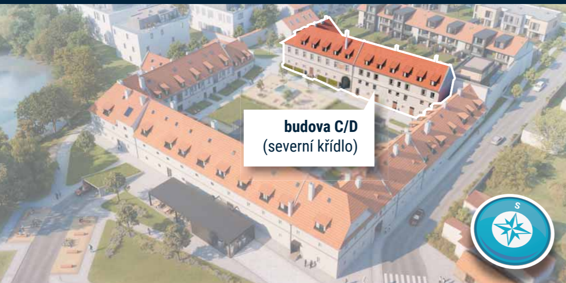
budova C/D (severní křídlo)